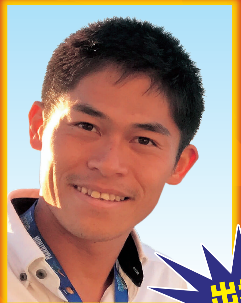
ゲストランナー 川内 優輝 選手